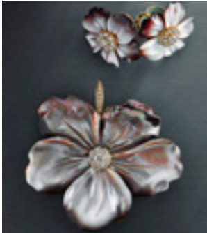
Perlmutterblüten und Brillanten

► Turmalin mit Brillanten und Gold, 8,5 x 5,5cm absolute Rarität