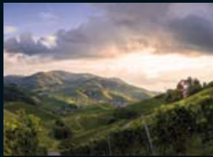
Durbach, Schloss Staufenberg