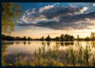
Baggerseen in Schwanau